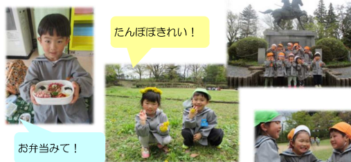
たんぽぽきれい！ お弁当みて！ 楽しいね！

年少さんはバスに乗り城山公園へ出掛け、バスから降りみんなで走ったり、ちょうちょを追いかけて遊びました。年中・年長さんは松倉中まで歩きそこからバスで城山公園へ向かいました。遊具やタンポポなどでたっぷり遊べ楽しかったです。お弁当などの準備をしていただきありがとうございました。