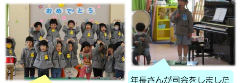
年中さん元気に歌っています 年長さんが司会をしました

その後は年長さんから、年少さんと新入園児さんに手作りのペンダントを「仲良く遊ぼうね」と、声をかけて渡しました。プレゼントをもらった、年少さんはにこっと笑顔でうれしそうに受け取っていて、すごくかわいらしかったです。未満児さんも一緒に参加して楽しみました。