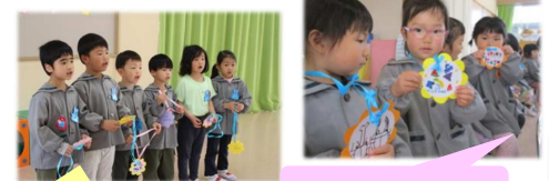
仲良く遊ぼうね！ ペンダントありがとう！