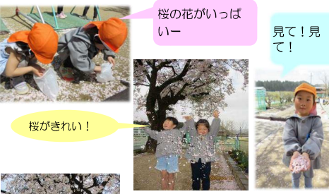
桜の花がいっぱいー 見て！見て！ 桜がきれい！ 園庭の桜が満開に咲いたよ！

桜を見に保育園の周辺を散策したり、新宮保育園の桜で記念撮影をしました。桜の花びらが、たくさん落ちてのを見つけて、「きれーい」と言って袋に入れて、「見て見て」と桜を集めたり、砂場では花びらのケーキを作り色々な桜を楽しみました。