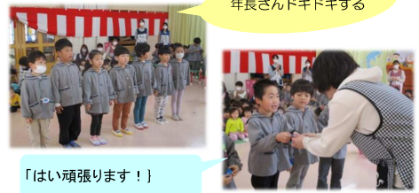
年長さんドキドキする 「はい頑張ります！」

進級式が4日にありました。クラスごとに呼ばれた年長さん。その立つ姿もかっこよく、名札を一人一人に渡すと大きな声で「はい」と返事をして「年長頑張ります」と決意表明をしていて、そのカッコいい姿に保育士全員から自然と拍手が沸き起こっていました。